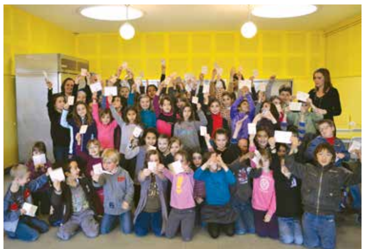
Résultats et délivrance officielle du permis piéton

Le groupe Construire Ensemble St Mathieu de Tréviars www.construire-ensemble.info