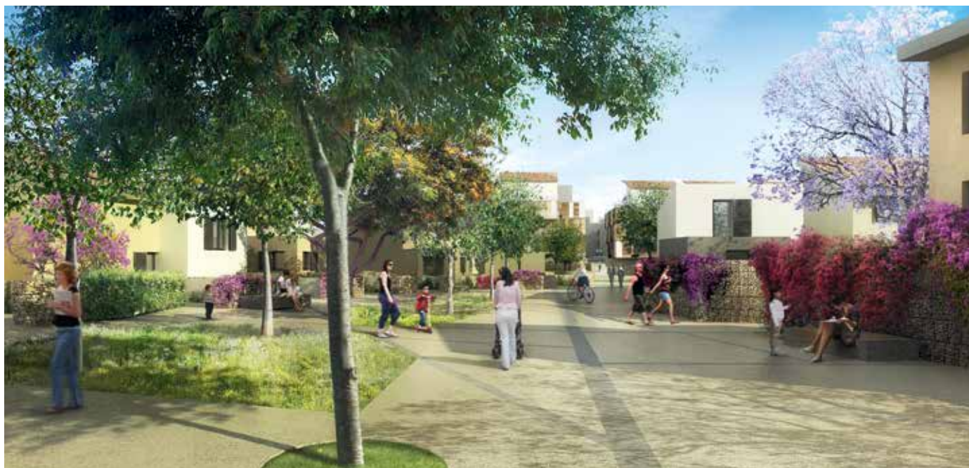
Esquisse d'aménagement réalisée par l'architecte Antoine Garcia-Diaz