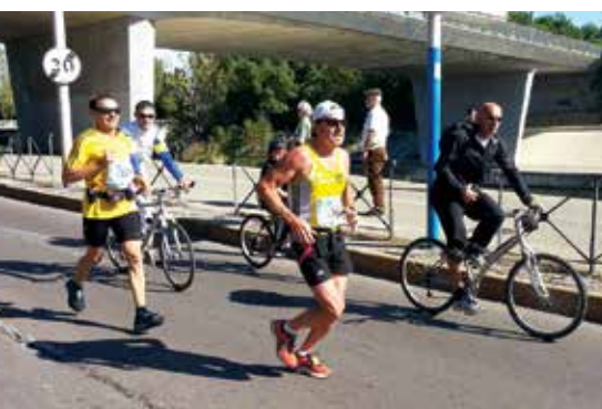
Saint Mathieu Athlétic

LE GUETTEUR DE MONTFERRAND : Directeur de la publication : Jérôme Lopez - Responsable de la rédaction : Mélanie Ponce Mairie de Saint-Mathieu-de-Trévières : Place de l'Hôtel de Ville - BP 29 34270 SAINT MATHIEU DE TRÉVIERS