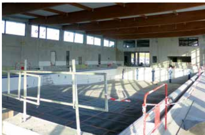
Le bassin intérieur de 25 mètres