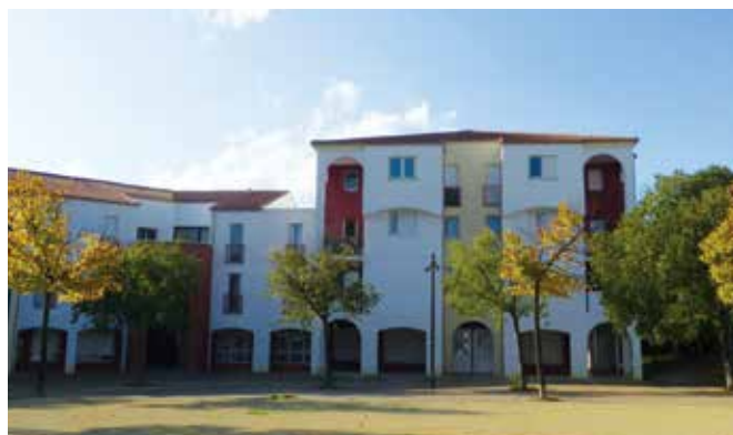
Résidence le Belvédère